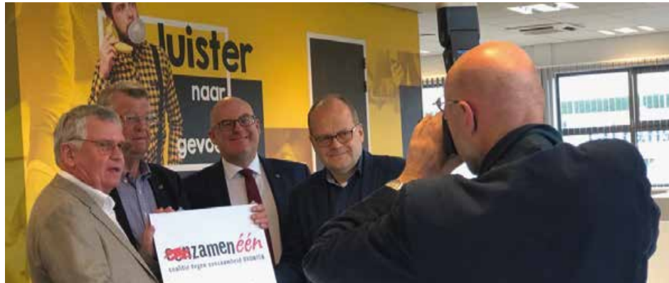
Ook Drontense ondernemers bouwen mee aan ZamenEen. Zo stelde KWOOT het logo beschikbaar (zie foto) en bouwde VWA de website.

Ook onze trainingen en scholing hebben wij klaar. Wij trainen en scholen de